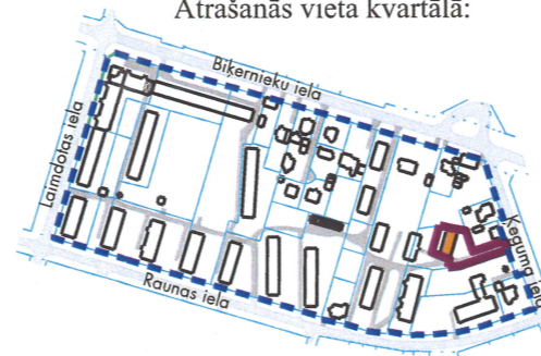
Atrašanās vieta kvartālā:

3. Funkcionāli nepieciešamā zemes gabala robežas, platība, apgrūtinājumi un to platības tiks precizētas veicot instrumentālo uzmērīšanu dabā.